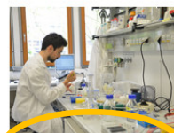
Formulare und Dokumente