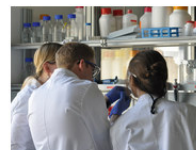
Informationen zum Studium

Herzlich Willkommen auf der Seite des Bachelorstudiengangs Biochemie. Hier finden Sie Informationen zur Bewerbung und zum Aufbau des Studiums, aktuelle Ankündigungen und vieles Weitere. Sollten Sie auf unseren Seiten nicht fündig werden, können Sie sich bei Fragen an das Studienbüro wenden (siehe Kontaktbox in der rechten Spalte).